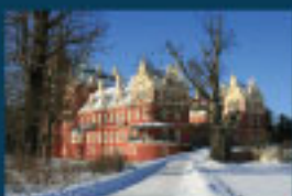
3 Muskauer Park UNESCO Welterbe / Muskauer Park / Park Mużakowski