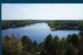
12 Geopark Muskauer Faltenbogen / Muskau Arch / Łuk Mużakowa