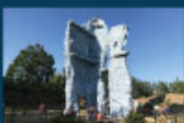
9 Kletterpark Krauschwitz / Climing Park / Park linowy