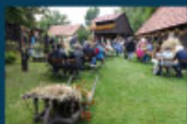
2 Erlichthof Rietschen / Erlichthof Grounds / Teren „Erlichthof“