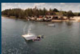
6 Halbendorfer See mit Wakeboardanlage / Lake Halbendorf / Jezioro „Halbendorfer See“