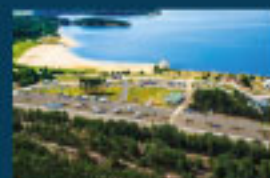
1 Bärwalder See / Lake Baerwalde / Jezioro Bärwalde