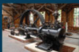
8 Museum Sagar / Museum Sagar / Muzeum w Sagar