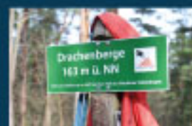
7 Wanderung durch die Drachenberge / Dragon Hills / Smoczyńi Wzgórzami