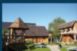
11 Erlebniswelt Krauschwitz / Indoor Fun Pool / Pływalnia kryta