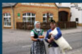
5 Sorbische Kultur in Schleife und Rohne / Sorbian Culture / Kultura sorbska