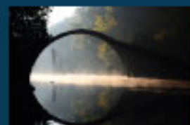
4 Rhododendronpark Kromlau / Rhododendron Park / Park Rododendronów