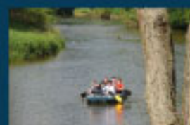
10 Bootstouren auf der Neiße / Boat trips / Spływy pontonem