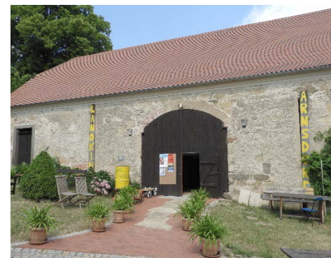
Landkino Arnsdorf

Bis zum 27.09.2018 um 15.00 Uhr können für den aktuellen Projektauftrag Projektanträge beim Regionalmanagement für die LEADER-Region Östliche Oberlausitz gestellt werden. Erstmals gibt es im Tourismus erhöhte Fördersätze für Privatpersonen, Gewerbetreibende, Vereine und Kommunen. Die Lokale Aktionsgruppe (LAG) der Östlichen Oberlausitz möchte damit die Schaffung von Beherbergungskapazitäten und touristischer Infrastruktur sowie die Entwicklung von touristischen Dienstleistungen und Marketingmaßnahmen stärker fördern. Die Fördersätze für Erhalt und Neubau von Beherbergungskapazitäten wurden z.B. auf 50 % erhöht. Die Mindestanzahl von 9 Betten entfällt. Die Übernachtungsplätze müssen nach der Fertigstellung in einem buchbaren Portal oder Gastgeberverzeichnis angeboten werden. Die Fördersätze für die Schaffung öffentlich zugänglicher touristischer Infrastruktur und die Entwicklung von Tourismusedienstleistungen und Marketing wurden für Private auf 50 % erhöht.